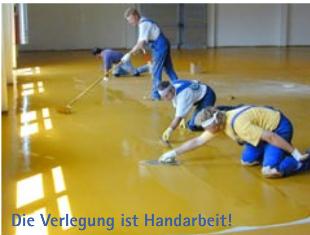
Die Verlegung ist Handarbeit!